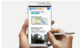
Pantau Progress Pengerjaan

Silahkan Berkonsultasi Design Gratis dengan team arsitek Rizky jaya yang berpengalaman