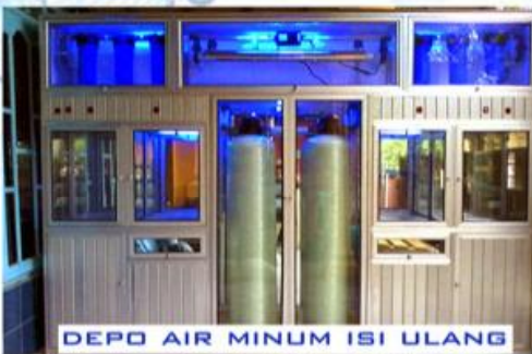
DEPO AIR MINUM ISI ULANG