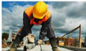
Tenaga Ahli & Berpengalaman

Kami memberikan GARANSI atas seluruh pekerjaan yang kami lakukan