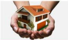
Cash & KPR

Pertama di Indonesia anda dapat melihat progress pembangunan rumah anda kapanpun melalui gadget