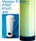
Water Filter FRP PVC SS