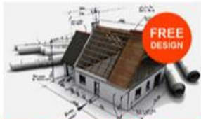
Free Konsultasi Design

Nikmati layanan Free Survey & konsultasi bangun atau renovasi rumah untuk wilayah Surabaya