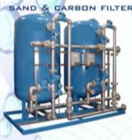
SAND & CARBON FILTER